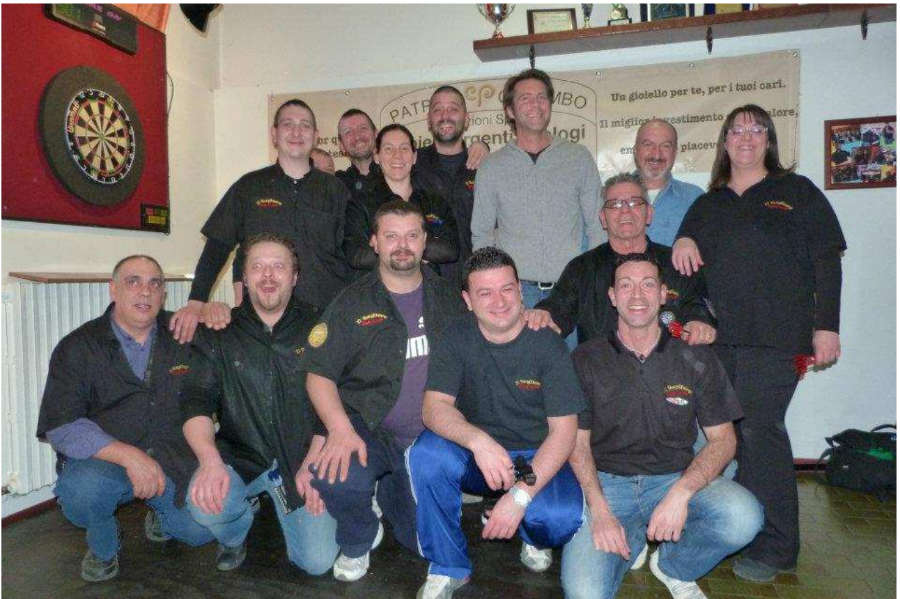
Il Principe Emanuele Filiberto con il dart club Il Tagliere