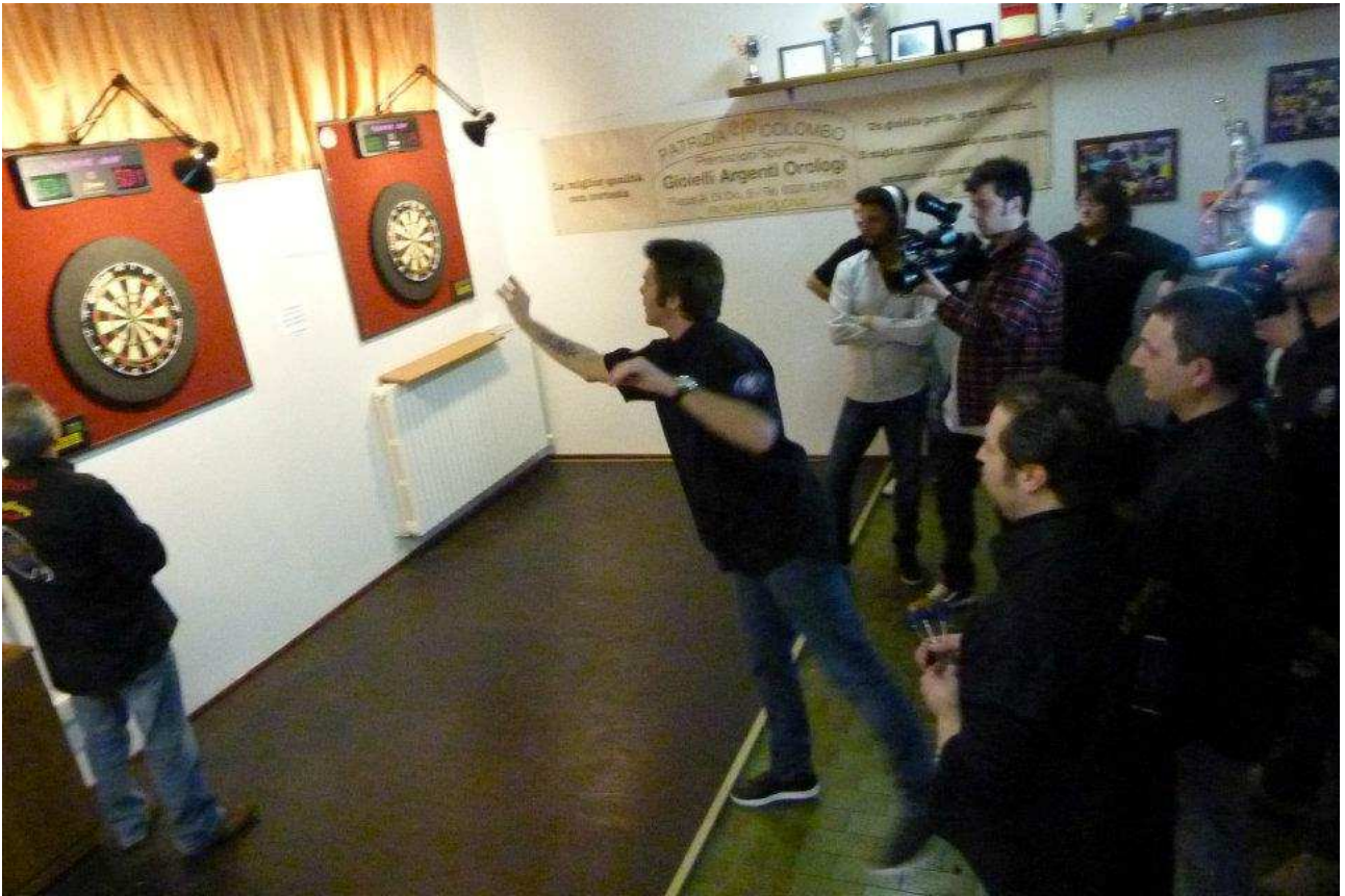
Il Principe Emanuele Filiberto in pedana al dart club Il Tagliere