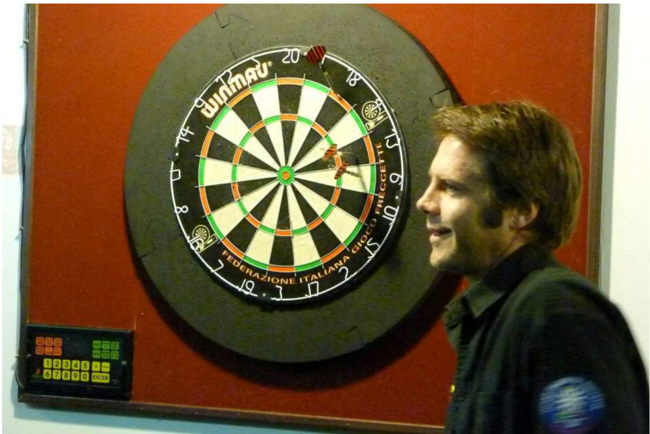
Il Principe Emanuele Filiberto ha "chiuso" un leg

Il noto rampollo della famiglia Savoia, dopo aver dimostrato di saperci fare con l'affettatrice, ha partecipato ad un torneo di freccette in un bar del paese